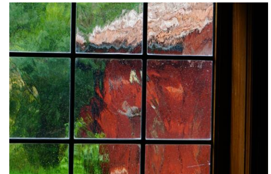
A Portée de Regard(s) - 2020