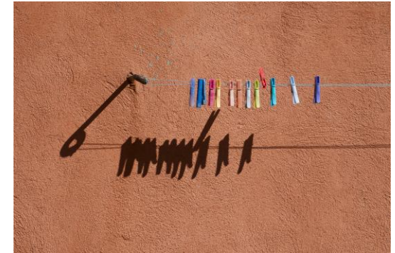
Année Lumière - 2018