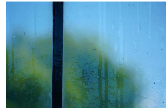
A Portée de Regard(s) - 2020