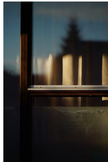
A Portée de Regard(s) - 2020