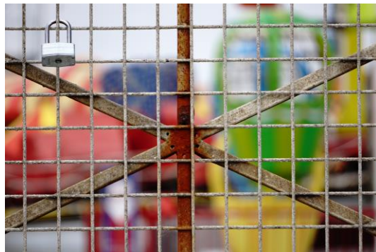
Pieces Of Portsmouth - 2017