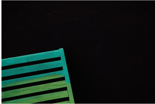
En Pleine Lumière - 2017