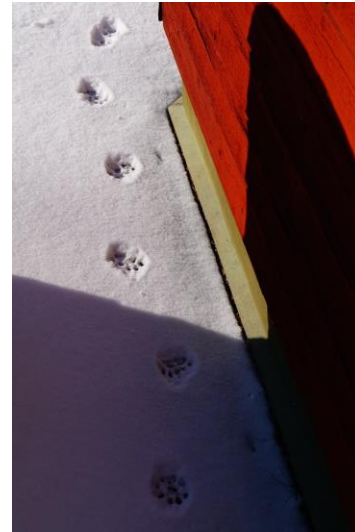
4 Saisons Suñedoises - 2019