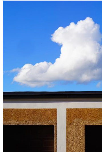
4 Saisons Suñedoises - 2019