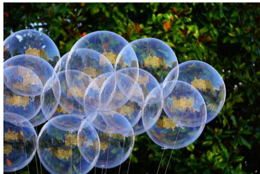
Année Lumière - 2018